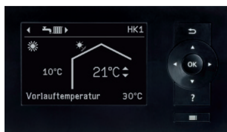
Display på värmepumpreglering Vitotronic 200