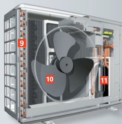
Vitocal 242-S/222-S Utomhusenhet